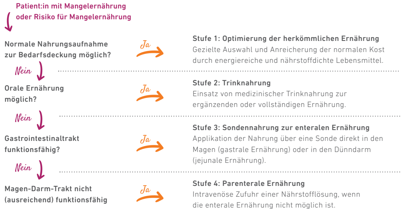
Abbildung 2: Modifizierte Darstellung der Stufen der Ernährungstherapie. 5

Neben der kausalen Behandlung der Ursache (z. B. Therapie der Grunderkrankung) müssen geeignete Maßnahmen zur Sicherstellung der Ernährung in Form einer Ernährungstherapie eingeleitet werden. Dabei hat sich das Stufenschema der Ernährungstherapie etabliert und bietet eine strukturierte Vorgehensweise von kleineren bis umfassenderen Maßnahmen.