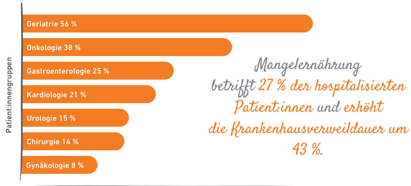
Abbildung 1: Prävalenz von Mangelernährung in deutschen Krankenhäusern nach Fachabteilungen. 1

Im Alter sowie infolge verschiedener Erkrankungen kann die Nahrungsaufnahme beeinträchtigt sein, sodass eine Versorgung mit ausreichend Energie und/oder Nährstoffen auf Dauer nicht sichergestellt ist. Während bei einer quantitativen Mangelernährung , Synonym auch als Unterernährung bezeichnet, zu wenig Energie zugeführt wird, ist die qualitative Mangelernährung durch eine Unterversorgung mit Nährstoffen gekennzeichnet. Beiden Formen gemein ist jedoch, dass sie häufig nicht auf den ersten Blick oder zu spät erkannt werden – mit weitreichenden Folgen für Gesundheit und Lebensqualität .